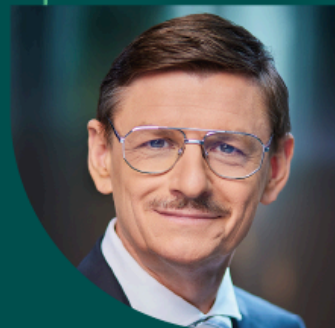
GRZEGORZ WROCHNA PREZES POLSKIEJ AGENCJI KOSMICZNEJ